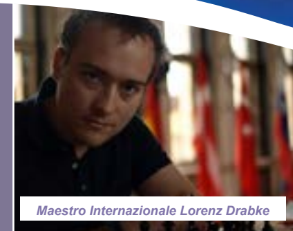
Maestro Internazionale Lorenz Drabke

Die Registrierung erfolgt in Form einer Eintragung über die Turnierwebsite ( http://www.salentochessopen.it ) und durch Zahlung der Registrierungsgebühr per Banküberweisung an Chess Projects ASD. Wenn Sie nicht beide erforderlichen Vorgänge abschließen, wird die Turnierregistrierung ungültig, die aber Am Spielstandort bis 14:00 Uhr unter Barzahlung zuzüglich des angeforderten Zuschlags ausgeführt werden kann.