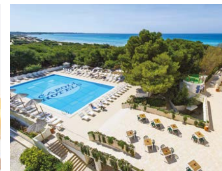
Piscina Ecoresort - Le Sirenè