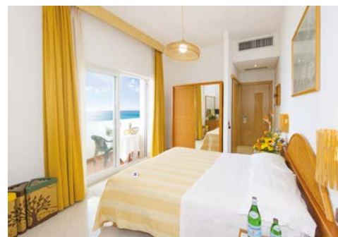
Stanza da letto Ecoresort - Le Sirenè