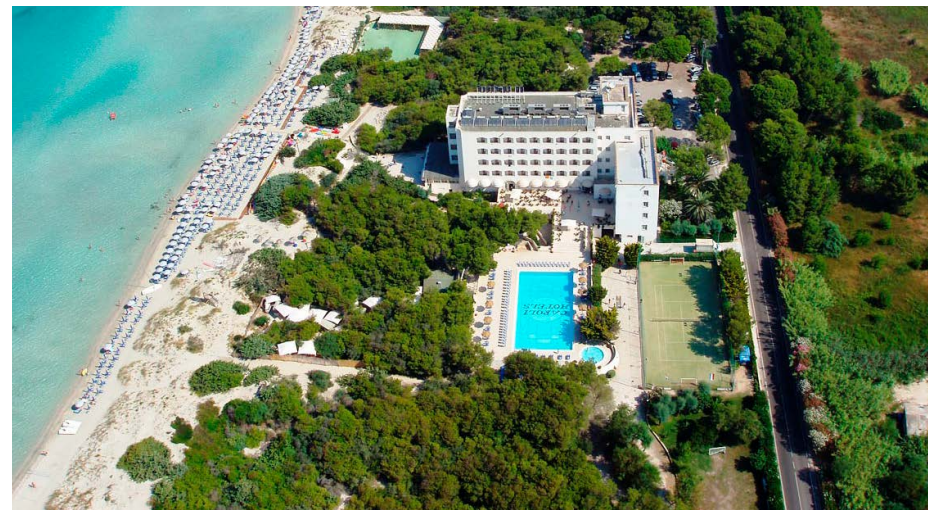
Il meraviglioso Hotel Ecoresort Le Sirenè di Caroli Hotels, posizionato in un'oasi verde a 8km da Gallipoli

Vi raccomandiamo di non effettuare su questo c.c. alcun pagamento riguardante le ISCRIZIONI AI TORNEI.